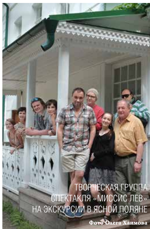
ТВОРЧЕСКАЯ ГРУППА СПЕКТАКЛЯ «МИССИС ЛЕВ» НА ЭКСКУРСИИ В ЯСНОЙ ПОЛЯНЕ

маленькая роль – это событие. Я выстраиваю все так, чтобы артистам было интересно, чтобы каждый их выход запоминался зрителю.