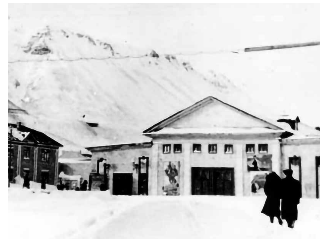
Первое здание 2-го Заполярного театра на улице Горной с 1940-х до 1954 года. Снимок 1950-х гг.

История Театра ГУЛАГа представлена, в основном, мемуарной литературой, поразительно мало сохранилось документов, только некоторые афиши и программы. Хотя на поселениях в Норильске и Воркуте, в созданных там театрах служили крупнейшие деятели. В 1995 году вышел сборник «Театр ГУЛАГа: Воспоминания, очерки». Также есть книги воспоминаний Георгия Жженова, Тамары Пегкевич и других актеров, связанных с театрами ГУЛАГа. Но даже в обществе «Мемориал» хранится совсем немного документов, связанных с поселениями в Норильске и Воркуте. Известно, что Лаврентию Берии доложили: в лагерях сидят многие театральные режиссеры, в том числе, режиссер Большого театра, Борис Мордвинов, ученик Станиславского и Немировича-