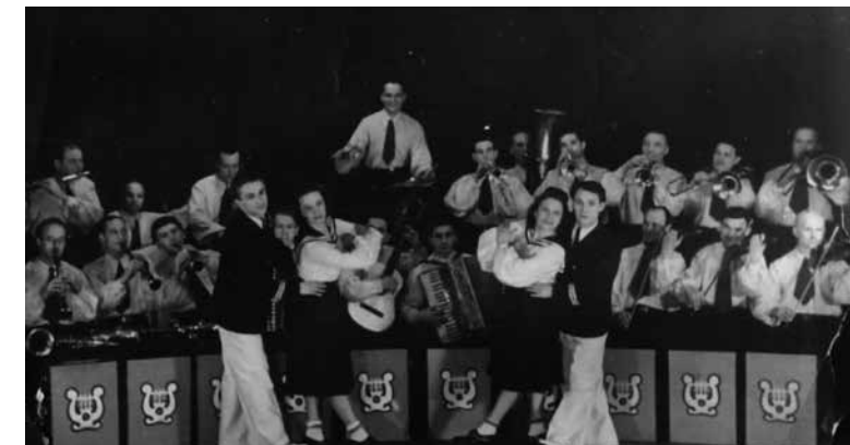
Выступление коллектива художественной самодеятельности Речлага. Конец 1940-х – начало 1950-х. Воркута (Коми АССР).

сова, попавшая в лагерь только из-за своего происхождения. После возвращения из театра ГУЛАГа, она стала знаменитой актрисой Ермоловского театра, много снималась в кино. Как ни странно, чтобы выжить в лагере, надо было сохранить человеческое достоинство. Это звучит немислимо, но вместе с тем так и было. В лагере не бытие определяло сознание, а наоборот, от сознания и неотвратимой веры в себя зависело, превратишься ли ты в животное или останешься человеком. А избыток таланта и образованности всегда были опасны для революции. Известен лозунг Сталина: «Если человек знаменит, значит, он опасен».