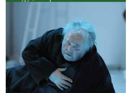
Александр Калягин в роли Просперо в спектакле «Буря» У.Шекспира. Режиссер – Р.Стурруа, театр «Et Cetera»

Изготовление парика для героя Калягина потребовало неимоверного терпения, деликатнейшей, ювелирной работы гримеров. Он имеет тончайшую основу – тюль, сотканную из тонкой паутинки. Сан Саныч играет в этом парике с премьерного спектакля: так бережно мы к нему относимся. Я каждый раз сам лично снимаю и надеваю парик, сразу ставлю на болванку, проспиртовываю клей, таким образом обновляю материал. Что касается самого грима, то мы решили сделать его «графичным», ведь сам спектакль, очень яркий, в нем много света.