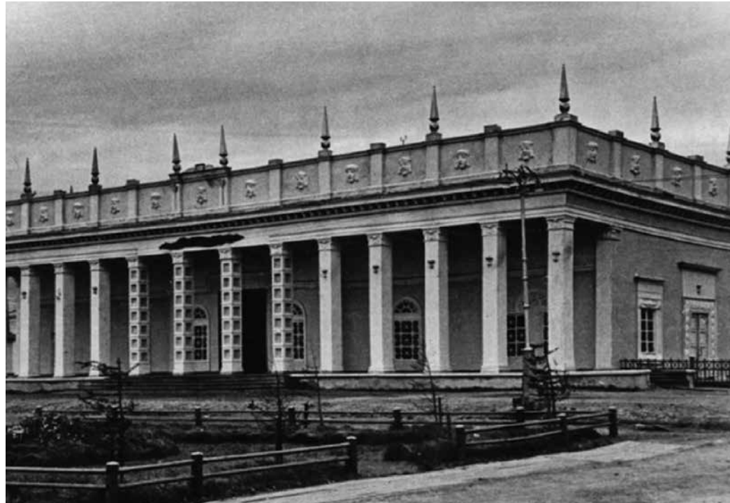
Музыкально-драматический театр г. Воркута. 1943 г. Создан в лагере политзаключенных.

атр. Этот театр подключил и концертные кружки, которые были во всех лагерных отделениях еще в конце 30-х годов. Именно эки составили основу театра, и с самого начала театр заявил о себе серьезным репертуаром. Из Островского были поставлены «На бойком месте», «Красавец мужчина», «Бесприданница», была поставлена «Женитьба» Гоголя, которая тогда редко шла в театрах, две пьесы Горького «Васса Железнова» и «На дне», и другие. Театр играл Мольера, Кальдерона, Гольдони, Шиллера. Ну и, конечно, были постановки на тему войны. В этом театре работал целый ряд знаменитых актеров, например, Иннокентий Смоктуновский. Во время войны он попал в плен, и после побега его определили жить на поселении и работать в этом театре. Жженов, как известно, переживший три ареста, просидел в общей сложности в ГУЛАГе 17 лет. В этом театре работала и княжна Евдокия Уру-