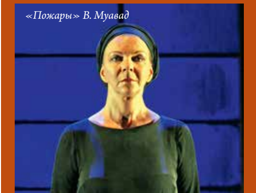
«Пожары» В. Мувад