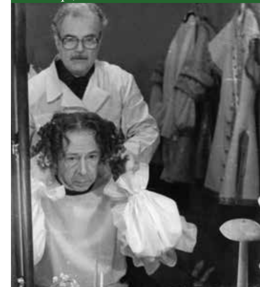
Олег Ефремов в роли Мольтера. Спектакль «Кабала святош» М.Булгаков. Режиссер – А.Шапиро, МХАТ им.Чехова. 1988 год

К работе с ним я готовился наиболее тщательно, заранее зная, что комментарии с его стороны будут минимальными.