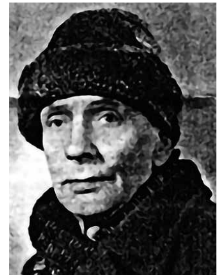
Композитор Сергей Федорович Кайдан-Дешкин

И очередной жертвой должен был стать как раз композитор Кайдан-Дешкин. Это было накануне большого праздника, ночью его забрали и увезли в «Норильск 2». Но музыканты отказались играть без своего руководителя и конвоирам пришлось его вернуть в оркестр. После той ночи он полностью поседел. В прошлом сезоне мы выпустили спектакль «Блаженный остров» по пьесе украинского драматурга Микола Кулиша, который оказался в лагере ГУЛАГа на Соловках. И начинаем мы новый сезон со спектакля к 75-летию Победы по мемуарным воспоминаниям Иннокентия Смоктуновского, который работал в театре ГУЛАГа. «Театр – одно из самых действенных полезных орудий в строительстве страны, это барометр, отмечающий ее величие или упадок. Чуткий театр, верно направленный во всех своих жанрах – от трагедии до водевиля, может в несколько лет изменить мировосприятие нашего народа. А театр искалеченный, у которого вместо крыльев – копыта, может развратить и усыпить целую нацию» (Лорка Г. Об искусстве.) Это было сказано 2 февраля 1935 года.