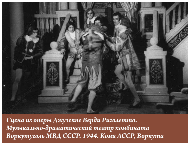
Сцена из оперы Джузеппе Верди Риголетто. Музыкально-драматический театр комбината Воркутуголь МВД СССР. 1944. Коми АССР, Воркута