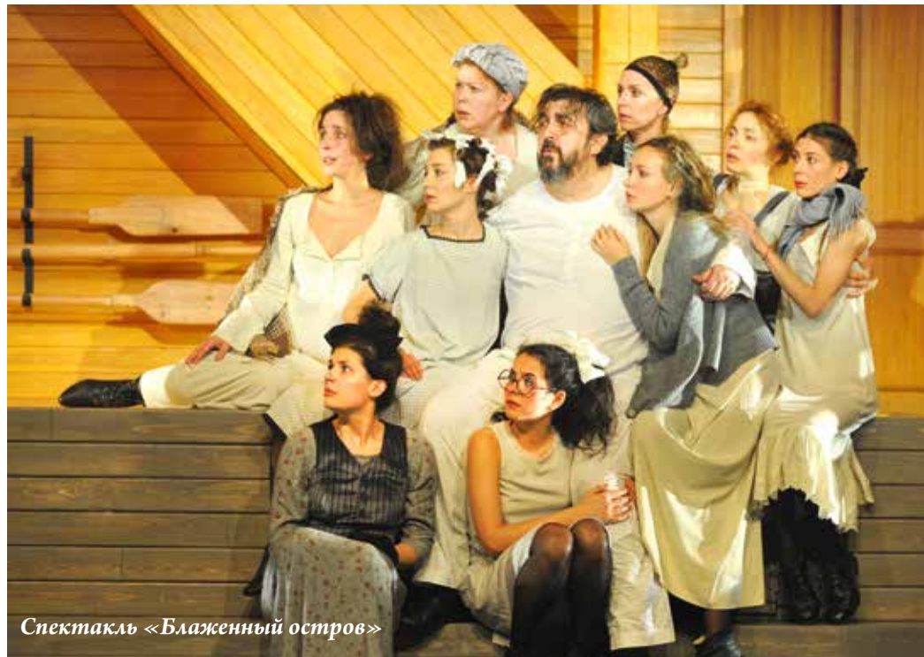
Спектакль «Блаженный остров»