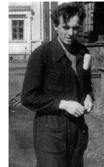
Иннокентий Смоктуновский в Норильске