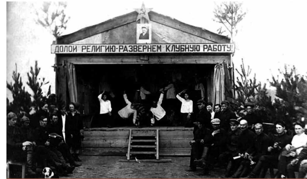
1936 год

Театры ГУЛАГа – явление малоизученное, драматичное и скрывающее за собой великие имена актеров и режиссеров, которые прошли через него. Мы решили рассказать вам о том, как изнутри был устроен театр ГУЛАГа на примере Норильского заполярного театра драмы и Воркутинского музыкально-драматического театра, и кто из известных театральных деятелей стал частью его системы. А ведь в одном из этих театров служил великий актер Иннокентий Смоктуновский, чьи военные воспоминания легли в основу нашего нового спектакля «БЫТЬ!»