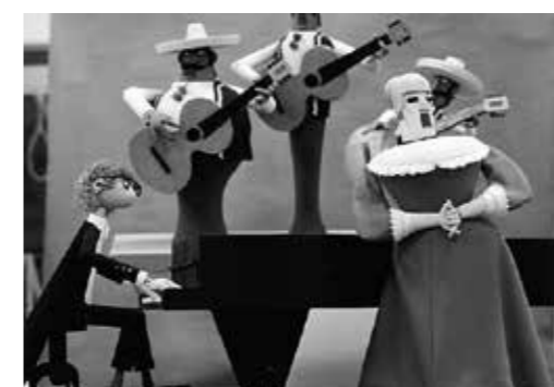
«Необыкновенный концерт» в Театре кукол им. Образцова, 1976 год

Театры кукол росли, как грибы после дождя: если в 1918 году был официально учреждён первый, то через некоторое, непродолжительное, время их насчитывалось уже более ста по всей стране. Несмотря на ощутимый «перекосяк» в восприятии кукольного театра в то время как исключительно детского, его создатели не забывали, что он универсален и своей исторической роли театра «для взрослых» отнюдь не утратил.