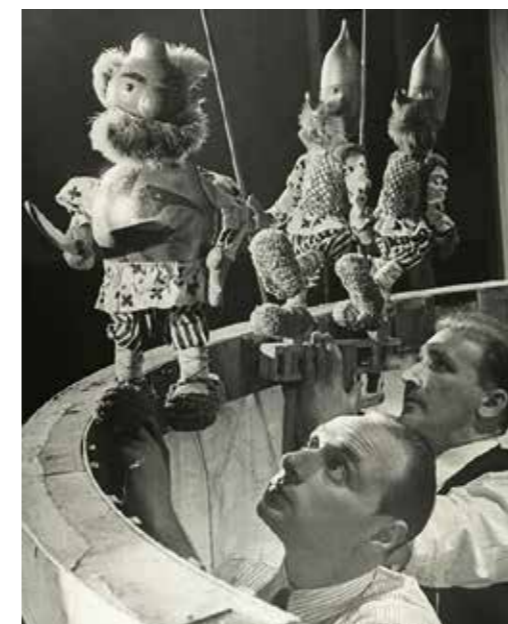
Спектакль «По щучьему велению» Театра кукол имени Образцова, пронизанный сказочной атмосферой, с уникальной конструкцией круглой ширмы многие театроведы называли «главным кукольным спектаклем XX века».

Театр кукол в советское время был переформатирован и приобрёл статус профессионального театра для детей. Если на средневековой площадной ярмарке Петрушка (рус.), Полишинель (фр.), Пульчинелла (итал.), Панч (англ.) игнорировали ребёнка, то теперь их кукольный мир целиком стал его привилегией. Театр кукол активно развивался, подстраиваясь под новые реалии и требования. Репертуар строился на сказках, мифах, детских литературных произведениях. Совершенствовался визуальный ряд: ориентируясь на детское восприятие, спектакли стали зрелищными, а примитивные ширмы и убогие вертепы канули в Лету.