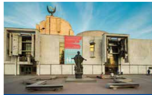
Детский музыкальный театр имени Натальи Сац

кальный, полностью «от и до» созданный для детей: от организации внешнего и внутреннего пространства до репертуара, адаптированного под каждую возрастную категорию, в зависимости от особенностей восприятия, с неизменным ориентиром на музыкально-эстетическое развитие детей. За вклад в развитие театра для детей Наталья Сац было присвоено звание «Мать детских театров мира».