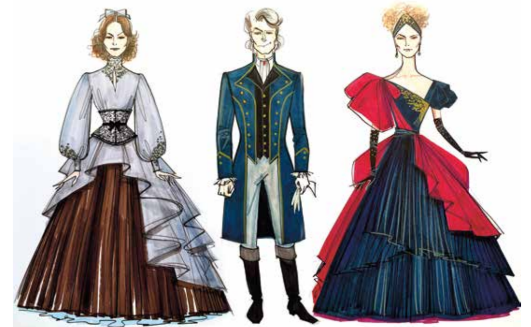
Эскизы костюмов героев Абигаиль, Болингброка, Королевы Анны

развязывает руки. Поэтому я с удовольствием мог мешать разные стили эпох, и сделал это смело: костюмы мужских персонажей придуманы в стилистике наполеоновского времени. И мы свободно