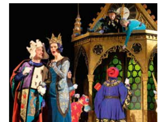
«Тайна тётюшки Мэлкин» А.Милана, Московский театр «Et Cetera»