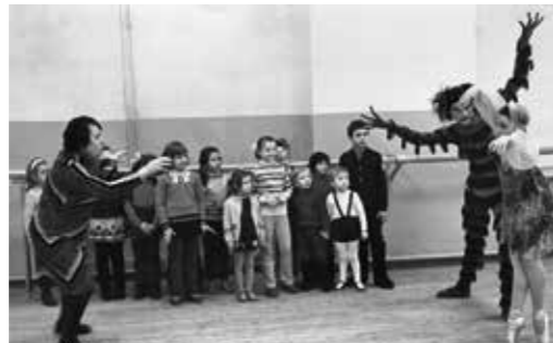
Главный режиссер театра Наталья Сац и герои сказки «Комар и самовар» во время встречи с маленькими зрителями, 1977 год

театра для детей переживало невероятный подъём (пока начавшаяся война не внесла свои коррективы). Особое место в истории детского театра занимает совершенно уникальная фигура НАТАЛЬИ ИЛЬИНИЧНЫ САЦ . Несмотря на сложнейшие жизненные перипетии, она создала целых три театра, ставших культурным явлением эпохи, образцом «радостного театра» для детей и реализовавших её идею о театре как об «удовлетворении потребностей детства, отделяя детские трудности от взрослых».