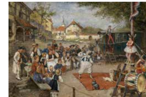
Поль Гюстав Доре «Бродячие артисты», 1874 год

ШКОЛЬНЫЕ, УНИВЕРСИТЕТСКИЕ И ЦЕРКОВНЫЕ, А ТАКЖЕ ПРИДВОРНЫЕ И ДОМАШНИЕ ТЕАТРЫ , получившие повсеместное распространение с XV века, играли спектакли по мотивам древнегреческих мифов, библейских притч