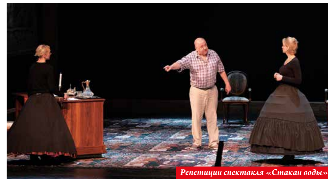
Репетиции спектакля «Стакан воды»

Накануне премьеры я чувствую, что спектакль на хорошем творческом ходу – и есть это ощущение творческого состояния, азарта – азарта легкого, который обязательно должен быть на выпуске именно этой пьесы, этого автора. Есть предвкушение, что все получится.