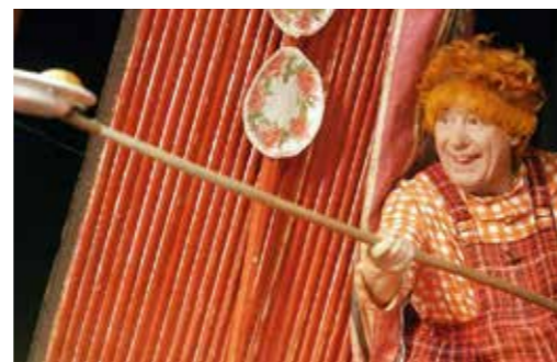
«Мальши и Карлсон, который живёт на крыше», Театр сатиры. 1968 год

В советский период детские спектакли, кроме театров для юного зрителя, проникали и в репертуар «взрослых» театров, становясь его полноценной частью. («Мальши и Карлсон», «Том Сойер», «Синяя птица», балет «Щелкунчик»)