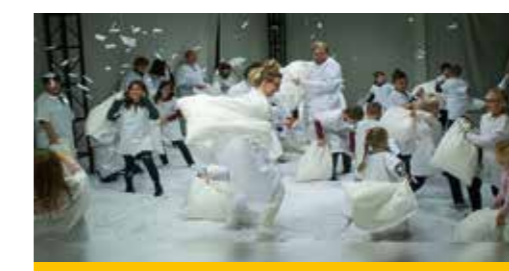
Спектакль «Школа сна», театр «Тригстер», 2017 год

Детский театр постоянно развивается. Сегодня он говорит с детьми на сложные темы, которых раньше избегал, например, о смерти. Проводит эксперименты с жанрами и формой, изобретает новые способы взаимодействия со зрителем (интерактивные спектакли, «бэби-театр» для малышей от 0 до 3).