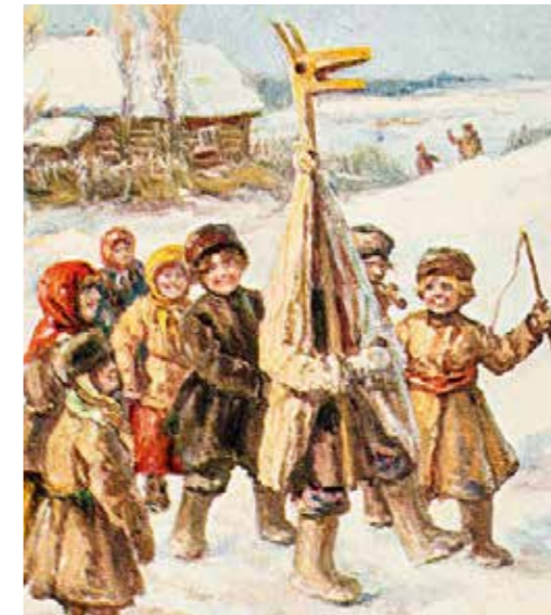
Дореволюционная рождественская открытка. «Рождественские гулянья»

ИСТОКИ ДЕТСКОГО ТЕАТРА лежат в глубокой древности. Пробразом его можно назвать всевозможные обряды с участием детей: заклинания дождя, хорошего урожая (считалось, что боги скорее исполнят просьбу юных невинных душ), посвящение детей в члены племени и т.д. Культовое действо, по сути, было первым театральным представлением: с музыкальным сопровождением (колотушками, дудками), переодеваниями, масками. Ритуальные фигурки богов и разыгрываемые с ними сюжеты стали прототипом будущего кукольного театра. Но всё же обряды, пусть театрализованные и с привлечением детей, пока ещё нельзя считать театром, тем более детским.