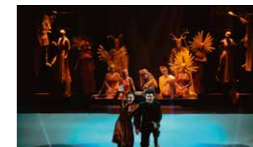
«Хроники Нарнии. Племянник чародея» Театр юного зрителя, Красноярск (реж. Р.Федори, 2018 год)

В НАЧАЛЕ XXI ВЕКА , наконец, пришло осознание, что необходимо «воспитывать» зрителя: если не привить любовь к театру сейчас, пока ребёнок мал и восприимчив, если не научить его понимать «язык» театра, если не объяснить ему вовремя правила игры, потом будет поздно, и через некоторое время, когда дети вырастут, зрительные залы опустеют. «Масштаб трагедии» стимулировал творческий процесс, и в последние десять лет ДЕТСКИЙ ТЕАТР ПЕРЕЖИВАЕТ БУРНЫЙ РАСЦВЕТ . Кроме того, что практически каждый драматический театр, за небольшим исключением, старается иметь в своём репертуаре «пул» детских спектаклей высокого качества, появилось множество частных, независимых детских театров и проектов. Учреждены многочисленные премии в области театра для детей, регулярно проводятся фестивали детских театров («Арлекин», «Гаврош», «Карабас», «Большой детский фестиваль» и др.). Невероятно поднялся престиж работы в театре для детей. Целое поколение молодых режиссёров пришло в эту область реализовывать свой потенциал, что стимулирует и мэтров периодически обращаться к детской аудитории.