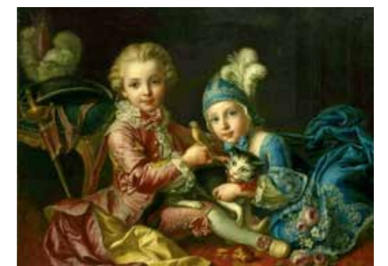
Франсуа-Юбер Друэ «Дети маркиза де Бетюна, играющие с собачкой», 1761 год

декораций, поднимающимся занавесом. Болотов не только изобрёл механику сцены и создавал декорации к спектаклям, но и сам писал пьесы для детской труппы, а главное – аудитории. Они носили назидательный характер: «Несчастные сироты», «Честохвал», «Награждённая добродетель». Автор считал, что серьёзные постановки помогут подготовить ребенка к взрослой жизни, и относился к делу с таким рвением, что его попросили в итоге покинуть