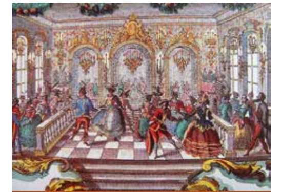
Придворный театр в России 17 века

Он стал прототипом привычного нам театра со сценой, зрительным залом, суфлерской будкой, кулисами, сменой